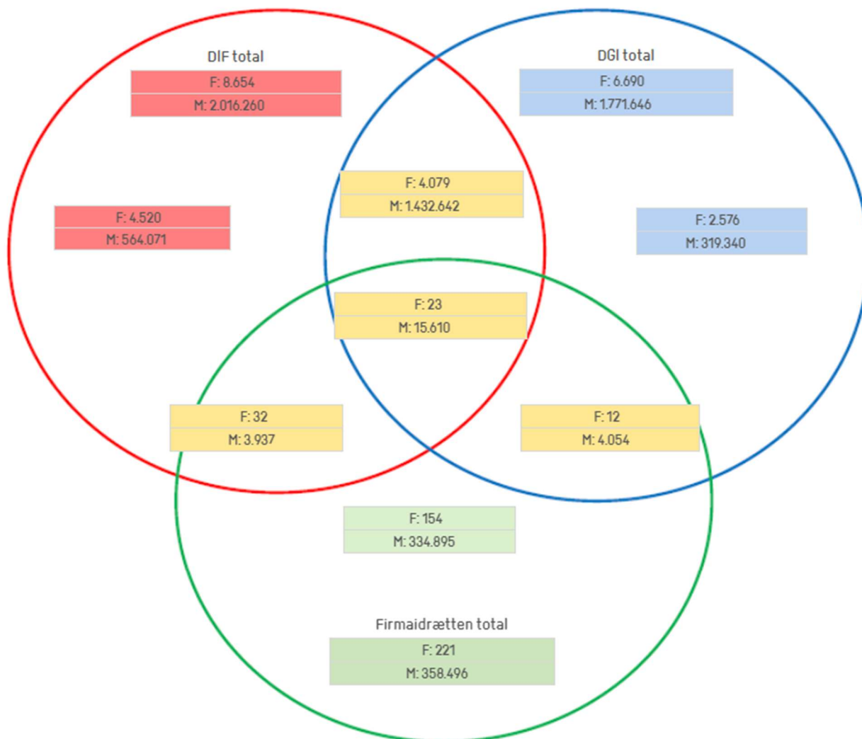
Figur 1 - Forenings- og medlemsoverlap mellem idrættens hovedorganisationer 2022, F=foreninger, M=medlemmer

I den røde cirkel ses, at DIF samlet havde 2.016.260 medlemmer i 2022. Disse medlemmer fordeler sig så