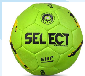
Street bold Str. 42 cm U6 og U7