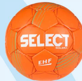
Str. 2 U15 + U17P Str. 3 U17D Standard Solera bold