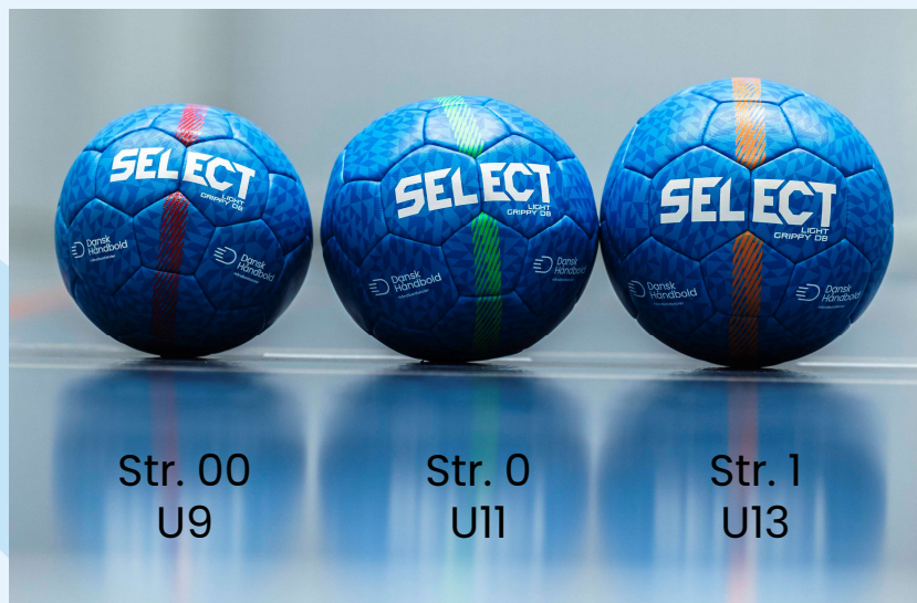
Str. 00 U9