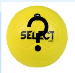
Str. 00 fast skumbold U8